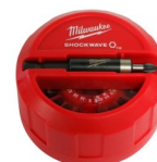
SET DE PUNTAS