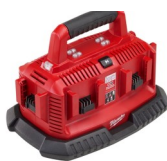
CARGADOR 18 V 6 EST.