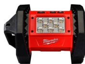
LÁMPARA DE TRABAJO