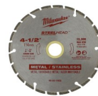
DISCO DE CORTE PARA