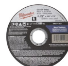
DISCO PARA ACERO