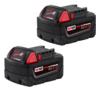
SET DE BATERÍAS 18V