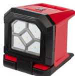
LÁMPARA DE TRABAJO