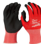
GUANTES ANTI CORTE