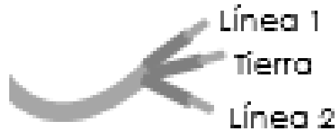
Figura N° 3 Conexión Eléctrica

En la Figura N° 3 muestra un diagrama que le ayudará a conectar eléctricamente su calentador.