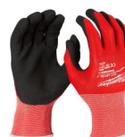
GUANTES ANTI CORTE N1