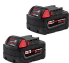
SET DE BATERÍAS 18V